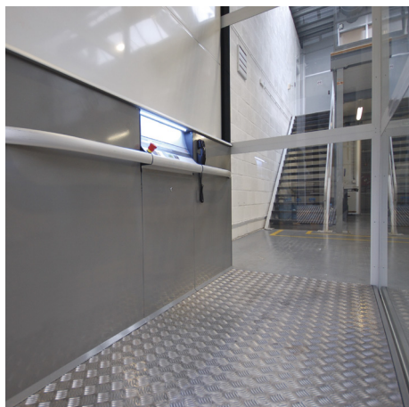
Revêtement de sol