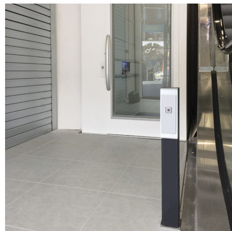
Bouton d'appel déporté