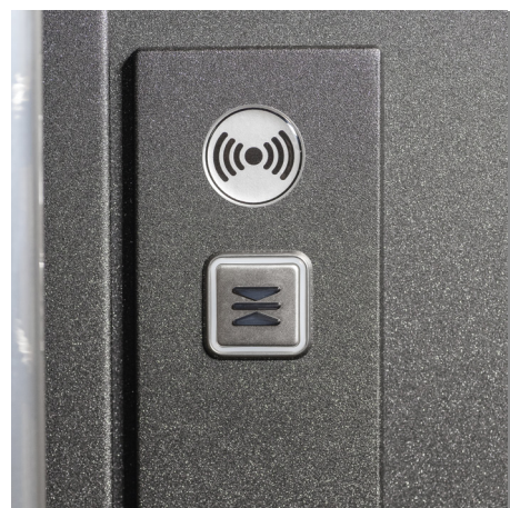
Dispositif de verrouillage par clé ou par badge