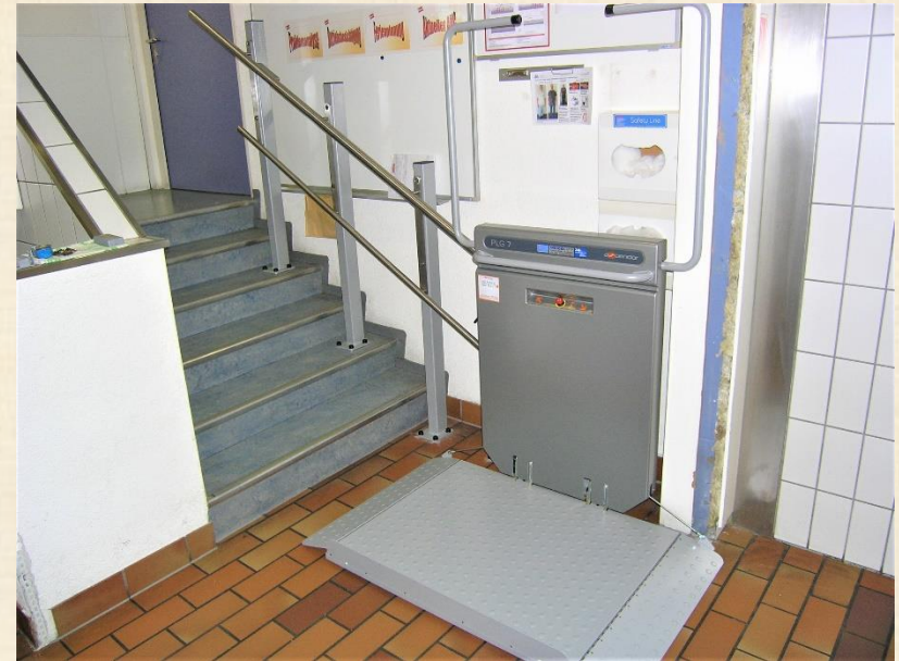
Haltestelle unten, Plattform offen zum Gebrauch