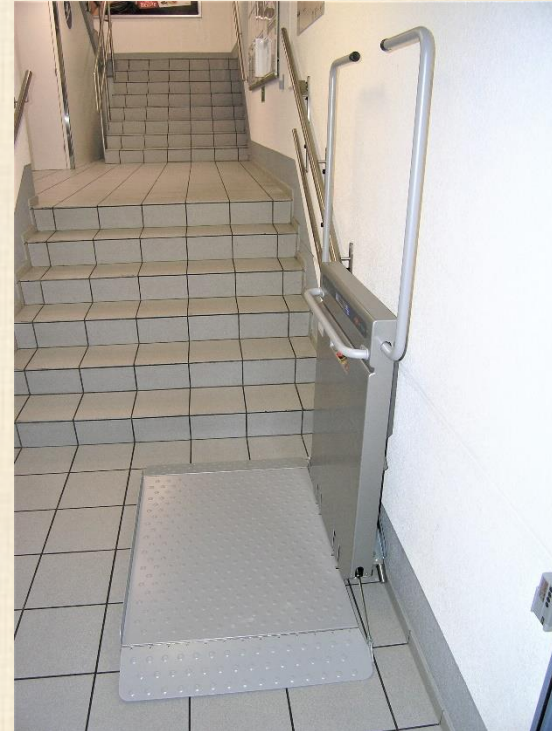
Haltestelle unten, Plattform offen zum Gebrauch