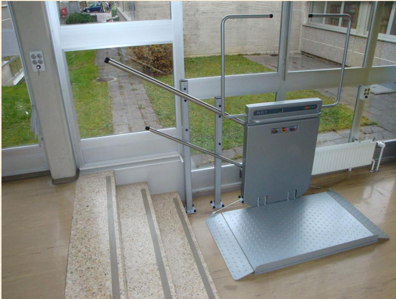
Haltestelle unten, Plattform offen zum Gebrauch