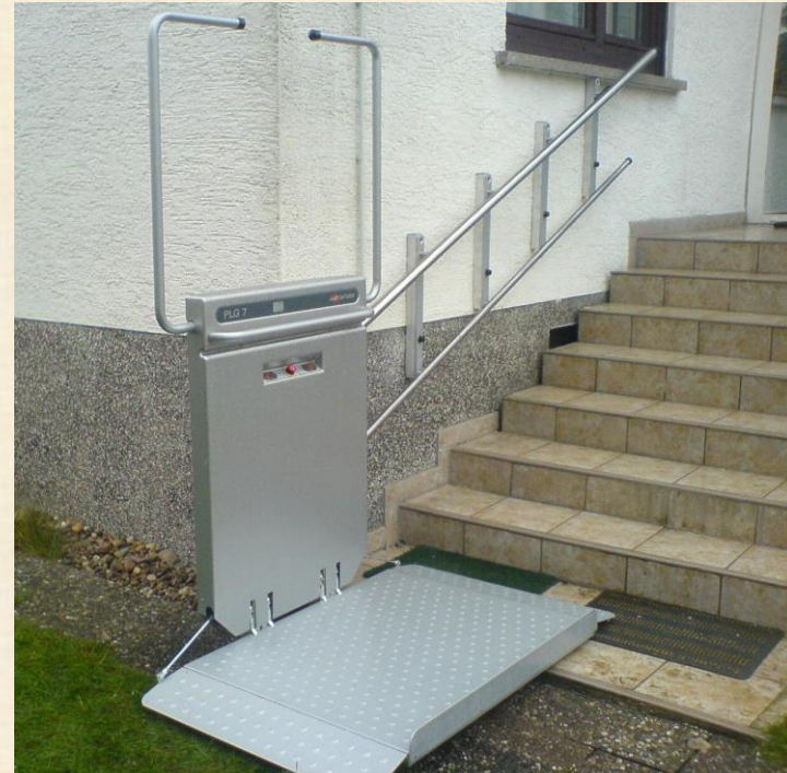
Haltestelle unten, Plattform offen zum Gebrauch