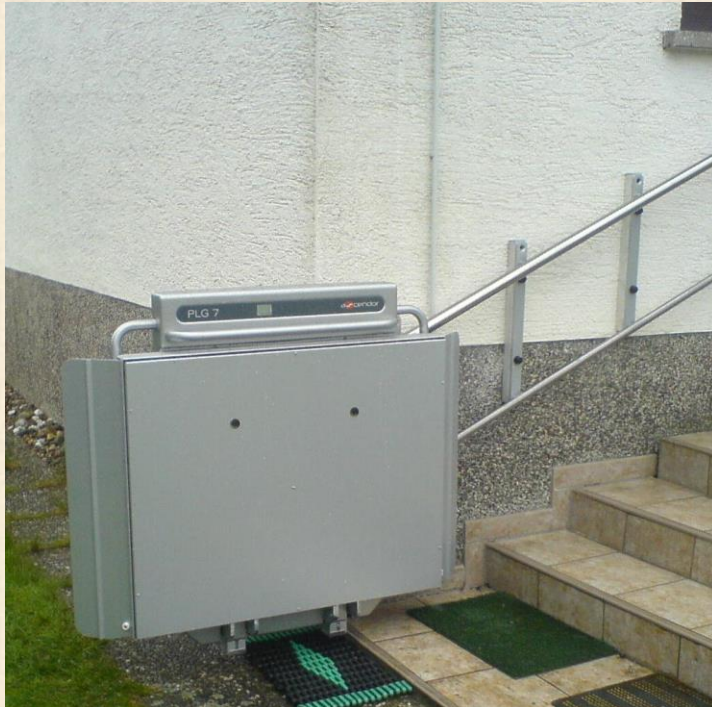
Haltestelle unten, Plattform geschlossen