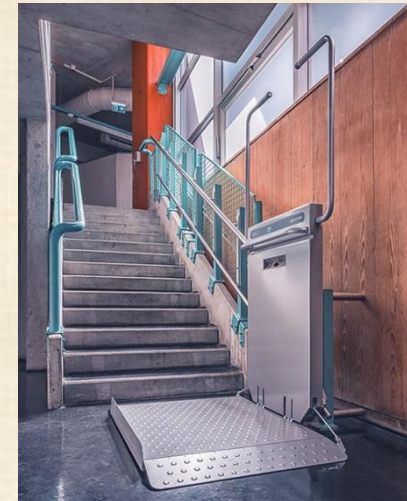
Stützen auf Treppenhange