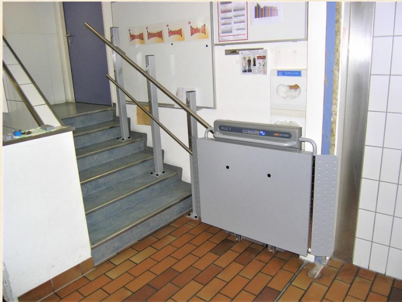
Haltestelle unten, Plattform geschlossen