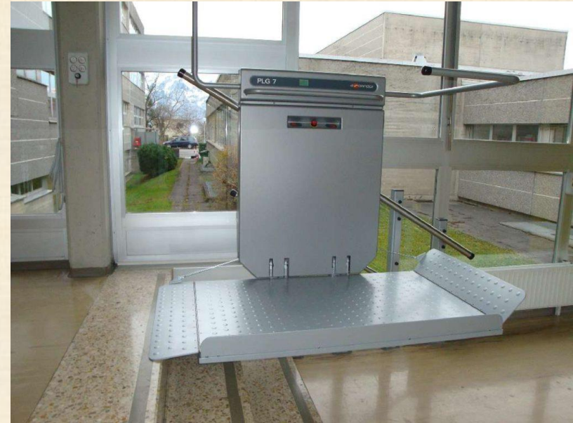
Haltestelle oben, Plattform offen zum Gebrauch