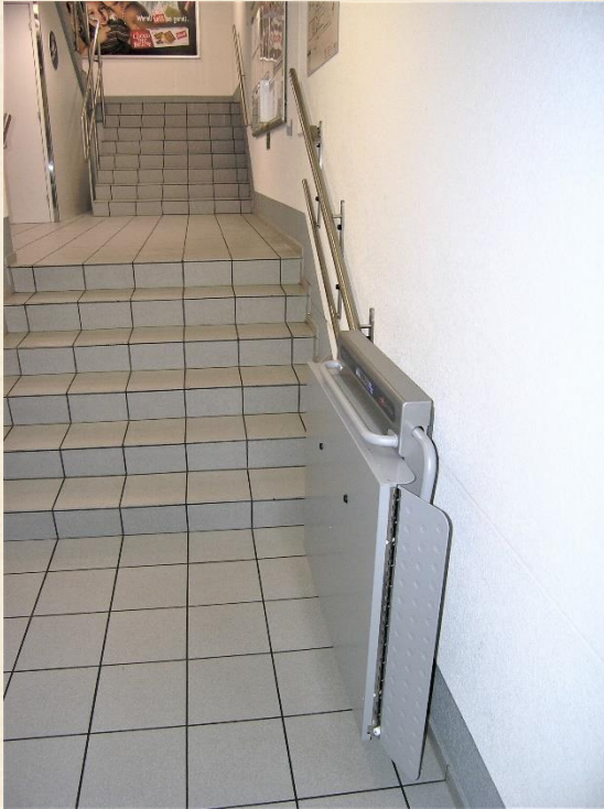
Haltestelle unten, Plattform geschlossen